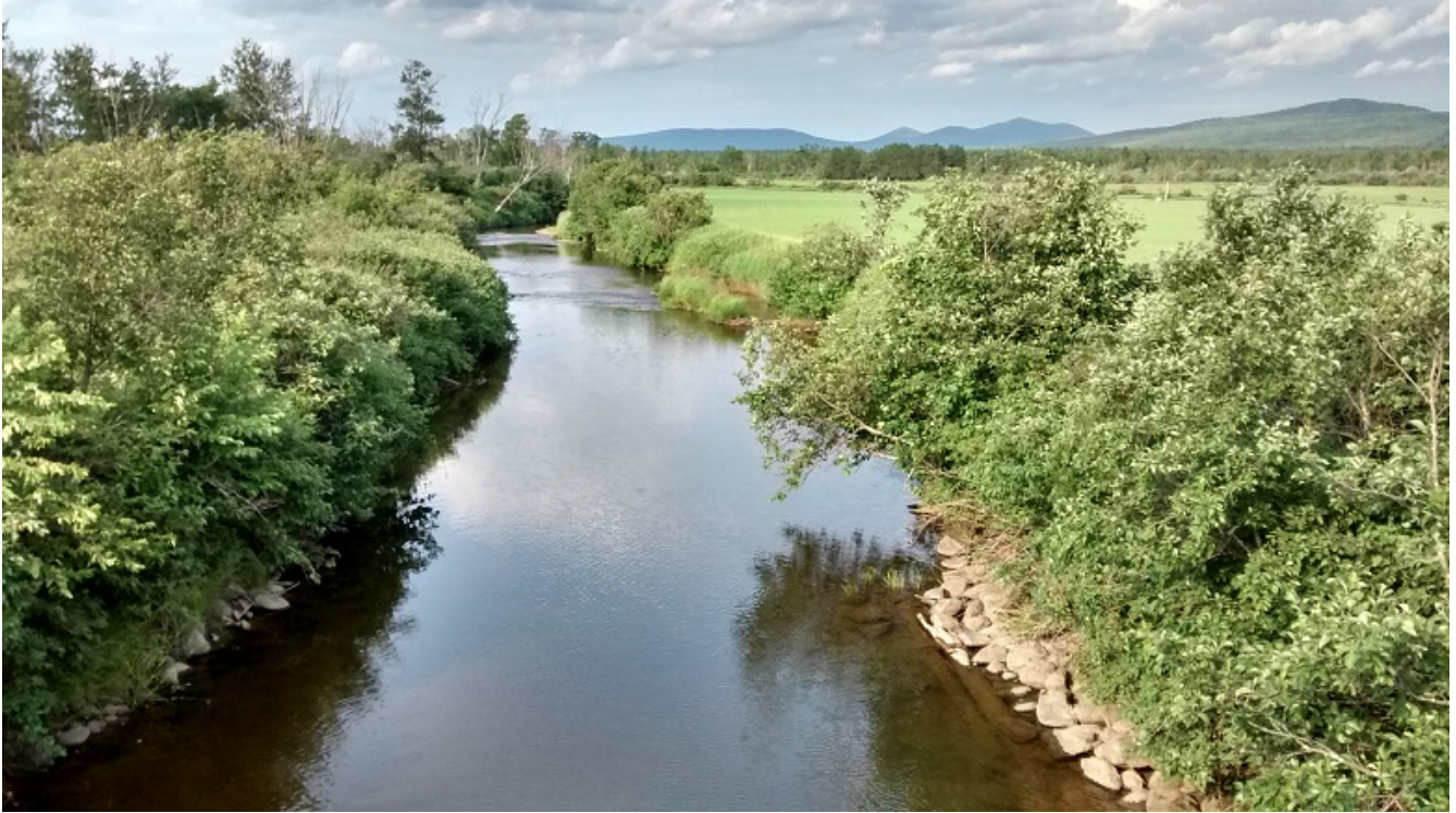
Rivière Clinton en aval du pont de la route 263

Finalement, les possibilités et les idées pour « passer à l'action » ne manquent pas. Bien que limitées, des ressources existent et se doivent d'être utilisées à leur plein potentiel pour la protection de l'eau. Il faut faire preuve de créativité alors qu'il y a tant à faire.